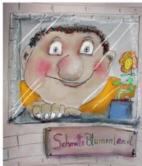
Der Riese Schmoll Kinderstück von Peter Futterschneider

Die beiden Riesen Groll und Schmoll bewachen einen Obstbaum und vertreiben alle Menschen, die gern davon naschen möchten. Schmoll mag aber eigentlich nicht böse sein. Er würde sich viel lieber um bunte, duftende Blumen kümmern. Eines Tages hat Schmoll genug und läuft davon. Auf einer wunderschönen Blumenwiese findet er mit dem Mädchen Julia und dem jungen Schneider Tom neue Freunde. Mit deren Hilfe möchte sich Schmoll einen Traum erfüllen: Einen eigenen Blumenladen in der Stadt. Doch auf dem Weg zu diesem Traum gibt es Hindernisse zu überwinden: Der König verbietet den Riesen jeden Handel in der Stadt. Inzwischen sucht Groll seinen alten Freund und vergisst dabei, dass er eigentlich ein grolliger Riese ist. Die Menschen lernen ihn von seiner guten Seite kennen. Bald bekommt er mit der Wache des Königs tatkräftige Hilfe bei der Suche nach Schmoll. Prinzessin Klara bringt einige Turbulenzen in diese Geschichte, die natürlich ein glückliches Ende nimmt.