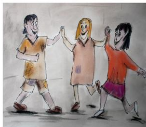
Der kleine Gambin XL Kinderstück von Peter Futerschneider

Der kleine Gambin lebt mit seinem Volk tief verborgen unter der Erde. Kein Mensch hat je einen Gambin gesehen und die Gambins gelten als Fabelwesen. Eines Tages besucht Merle die Nettetalhöhle. Dort hört sie zum allerersten Mal etwas über die Gambins. Fasziniert von der Sage versteckt sie sich in der Höhle. Zunächst fürchtet sie sich sehr, doch dann merkt sie, dass sie nicht allein in der Höhle ist. Sie lernt den Gambin Abalor kennen. Leider schenken die Erwachsenen ihren Worten keinen Glauben. Als man über der Höhle die sogenannten Seltenden Erden findet, gerät die Welt ihres neuen Freundes in Gefahr. Merle erlebt ein Abenteuer, in dem sie und Abalor als Wandler zwischen den Welten Widerstände überwinden müssen.