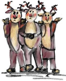
Drei Rentiere und kein Weihnachtsmann Märchen und Familientheaterstück von Peter Futerschneider

Die Rentiere Ralf, Richard und Rita sind aus ihrem Jahresurlaub zurückgekehrt und warten wie jedes Jahr am Treffpunkt auf den Weihnachtsmann, um gemeinsam für die große Bescherung zu trainieren. Doch sie warten vergebens. Außer ein paar Schülern, die sich über den Beginn der Herbstferien freuen, ist niemand zu sehen. Schnell dämmert den drei Rentieren, dass es in diesem Jahr zu Weihnachten keine Bescherung geben wird, wenn es ihnen nicht gelingt, das Geheimnis ihres verschwundenen Chefs zu lösen. Auf der Suche nach dem Weihnachtsmann bekommen die Rentiere tatkräftige Unterstützung von Frieda, Lara und Nils und von einem gewissen Obo, der von sich behauptet, der Oberosterhase zu sein. Es gilt, eine Menge Abenteuer zu überstehen und dabei ist völlig offen, ob die Suchaktion am Ende zum Erfolg führen wird.